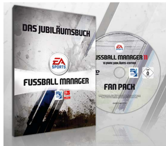
Jubiläumsbuch & DVD „Fan Pack“

Auf fast 100 farbigen Seiten erhalten die angehenden Manager zunächst alle wichtigen Tipps und Tricks zum Spiel. Der zweite Teil des Buchs zeichnet dann die Geschichte des Spiels und des Entwicklungsteams von den Anfängen im April 2000 bis zum Release des FM11 detailliert nach und erlaubt einen genauen Blick hinter die Kulissen. Das Buch enthält zahlreiche Screenshots und unveröffentlichte Fotos, eine Sprüchesammlung, einen Fragenbogen uvm.