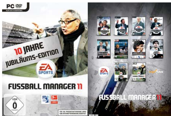
Pack der Jubiläumsedition

Der FUSSBALL MANAGER 11 feiert sein 10jähriges Jubiläum mit einer riesigen Anzahl neuer Features! Hunderte von Verbesserungen wurden umgesetzt, mit Schwerpunkten auf den Kernbereichen Aufstellung, Taktik und Transfermarkt.