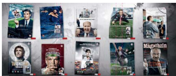
2 DVD-Folder (Rückseite)