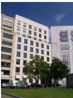
Neue_Niederlassung_Berlin.jpg: Die Räume der Berliner Niederlassung befinden sich am Leipziger Platz 14.

Pressebild download unter: http://www.ptv.de/unternehmen/news/presse/bilder/ Registerkarte Traffic